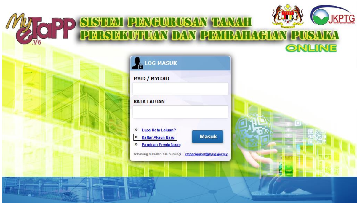
GAMBARAJAH 2: SKRIN PENDAFTARAN JKPTG ONLINE