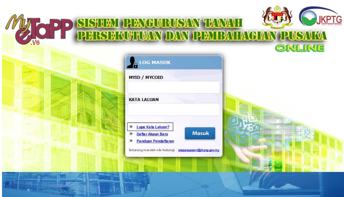
GAMBARAJAH 7: SKRIN LOGIN JKPTG ONLINE – LUPA KATA LALUAN