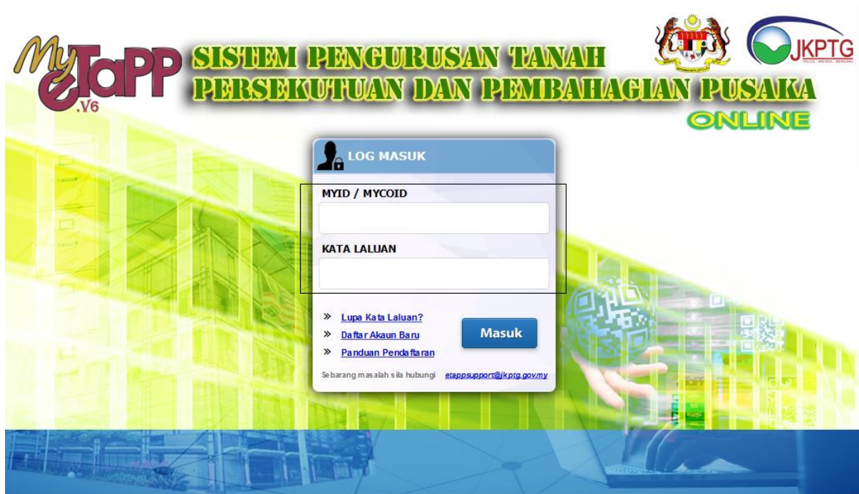
GAMBARAJAH 5: SKRIN LOGIN JKPTG ONLINE